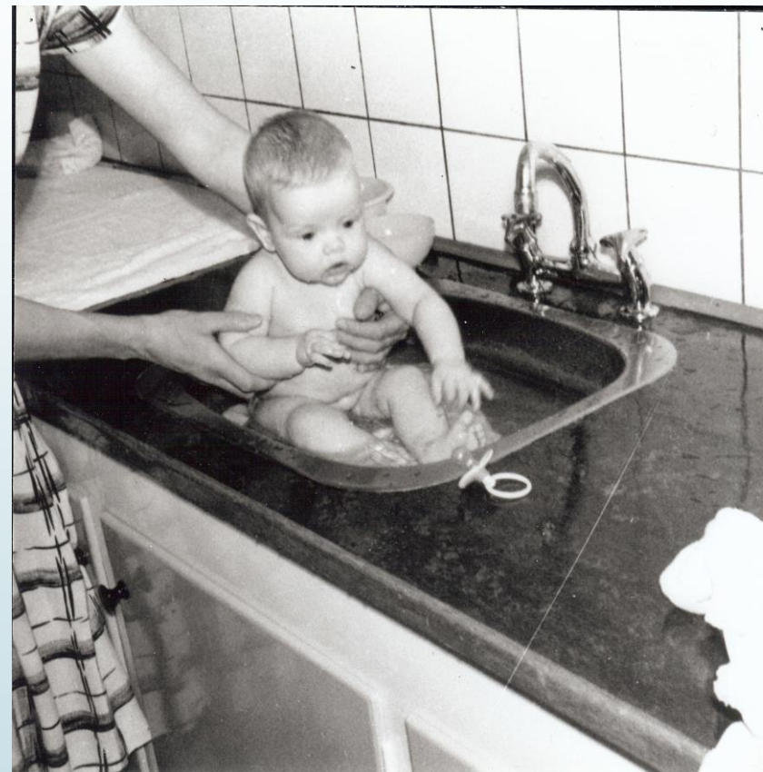
... (1963) og i køkkenet!