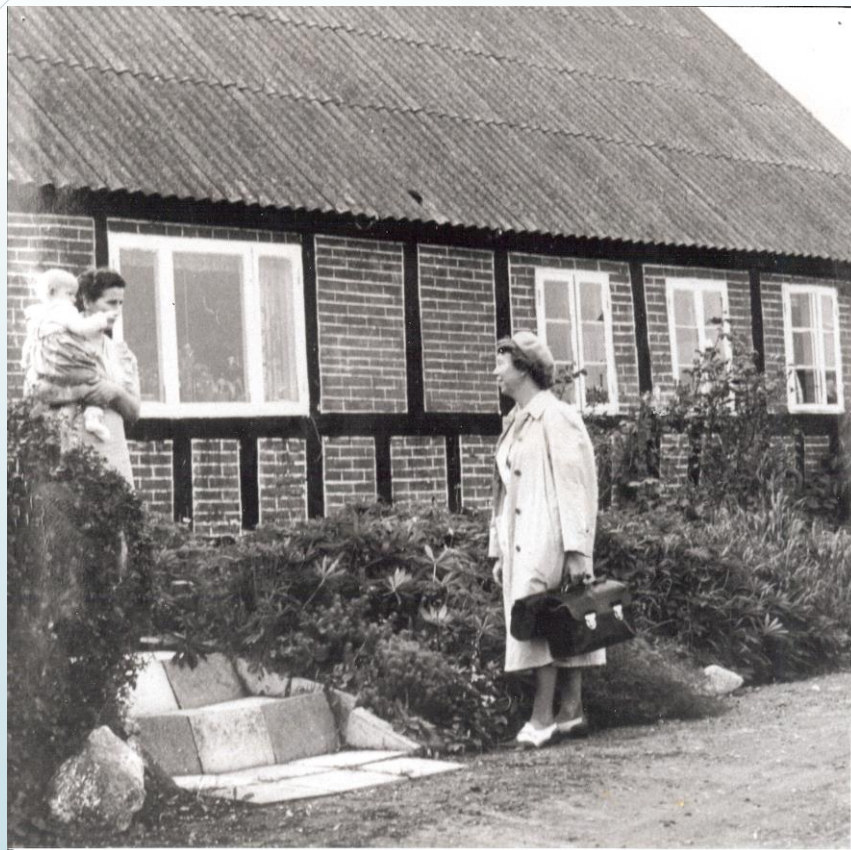
Ankomst til hjemmet